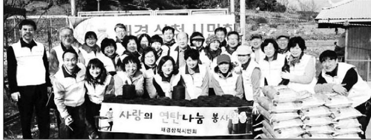
재경삼척시민회 연탄·쌀 나눔 재경삼척시민회 회원들은 17일 삼척시 근덕면 광태리 2가구 등 어려운 가정에 연탄 1만장과 쌀 10kg짜리 40부대를 전달했다.